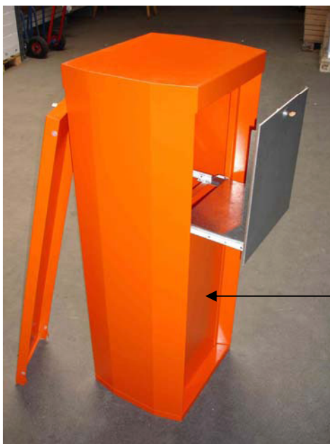
Vordere Abdeckplatte, mit zwei Flügel- muttern demontierbar

Die Säule kann auch von vorne unten geöffnet werden. Es müssen lediglich zwei Flügelmuttern entfernt werden, um die vordere Platte auszuhängen. Somit kann die Säule auch mit dem Rücken an eine Wand montiert werden.