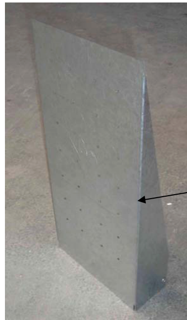
Montageplatte, 2mm verzinktem Blech